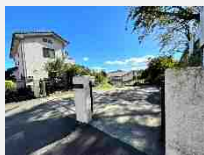
西山中学校：徒歩9分(720m)