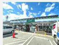
ファミマ+COOP鶴ヶ谷店：徒歩4分(278m)