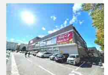
ツルハドラッグ・ファミナ鶴ヶ谷店：徒歩11分(868m)

【分譲宅地物件概要】●所在地/仙台市宮城野区燕沢二丁目5-25●交通/「JR東北本線」東仙台駅：徒歩18分●総区画数/2区画●販売区画数/1区画●用途地域/第一種低層住居専用地域●建ぺい率/50%●容積率/80%●道路幅員/西22.0m東6.7m(アスファルト)●地目/山林(現況：宅地)●主たる設備等概要/電気：東北電力、水道：公営水道、下水：公営下水●土地面積/163.79㎡(49.54坪)●販売価格/2,170万円●学区/仙台市立西山小学校(徒歩4分)、仙台市立西山中学校(徒歩9分)●売主/セルコホーム株式会社※この土地は土地売買契約後3か月以内に当社と建物の建築工事請負契約を締結していただくことを条件として販売致しますので、この期間内に建築工事請負契約が成立しなかった場合には土地売買契約の無効が確定し、受領した金銭は全額無利子にて返還致します。●広告制作日/2021年12月4日