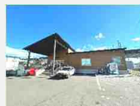
JR東北本線「東仙台駅」徒歩18分