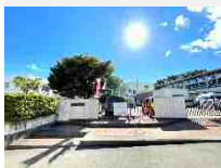
西山小学校：徒歩4分(245m)